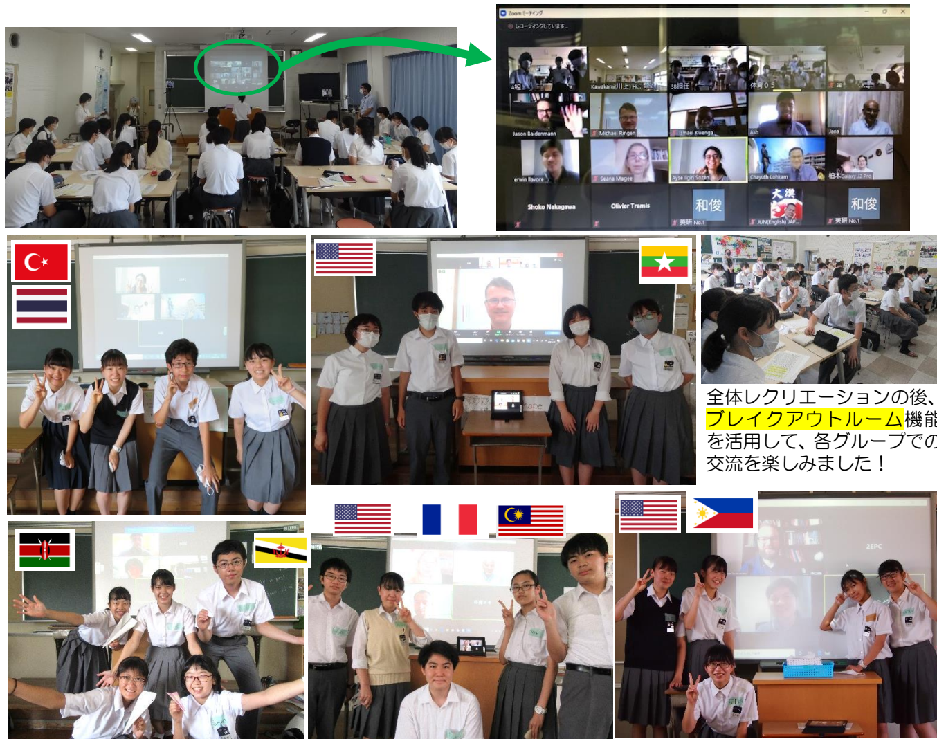
全体レクリエーションの後、ブレイクアウトルーム機能を活用して、各グループでの交流を楽しみました！

1～3年生23名と、トルコ、アメリカ、ケニア、ブルネイ、フランス、フィリピン、マレーシアから仕事や学業で来日中の皆さん、そしてミャンマー、タイの現地在住の皆さんなど、海外ゲスト 11名と、Zoomを使って英語で交流をしました。時差が生じている地域もありましたが、まさにリアルタイムでの国際交流に心躍った楽しいひとときとなりました。終わってみれば、あっという間の90分。これを機に、益々SDGsの視点での国際交流の意義を理解し、その一歩として諸外国語学習への興味・関心を高めてくれることを期待しています。参加してくれた生徒の皆さん、ありがとうございました。